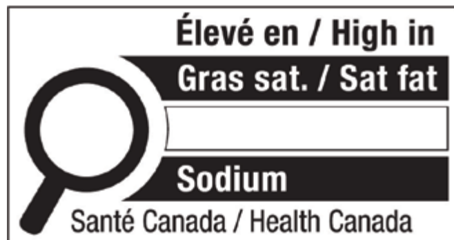
1. Image tirée du site du Gouvernement du Canada (13).

Exemple d'étiquette de mise en garde sous forme de loupe du Gouvernement du Canada